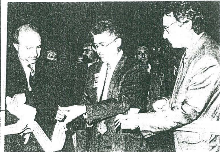
Acte d'inauguració de la Fira de Sant Lluç de l'any passat.

El compromís signat per tots els alcaldes del Montsià es de fer-lo allí on els estudis dels tècnics determinen com més favorable i menys perjudicial. Estem al bombo i amb molts de números.